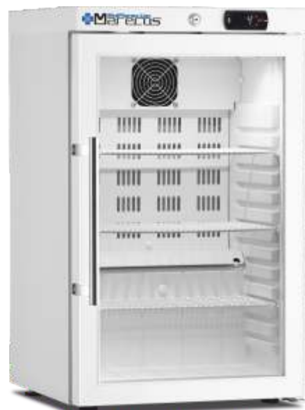
ARV 66 CS PV Pharma