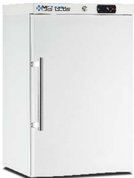
ARV 66 CS PO Pharma