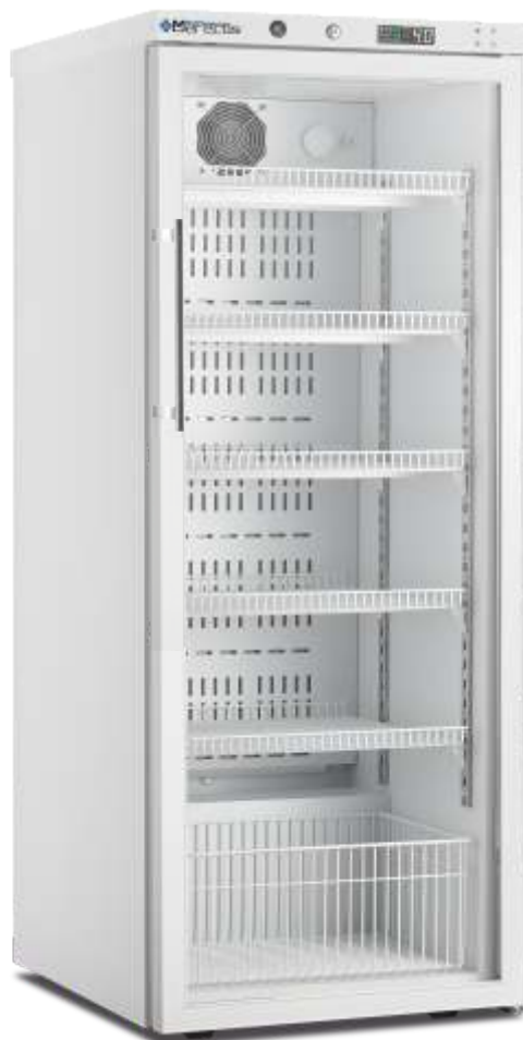
ARV 350 CS PV DIN