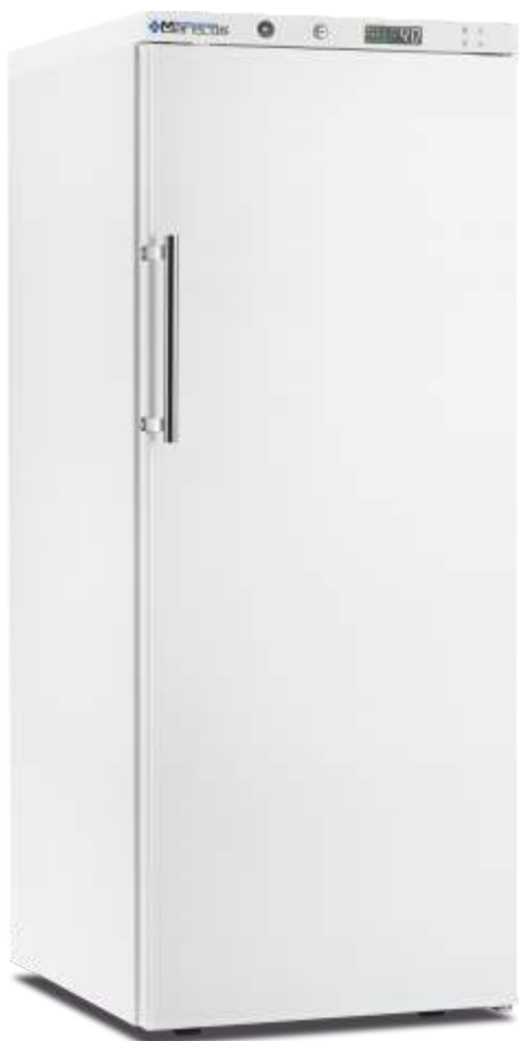
ARV 350 CS PO DIN

+2°C +8°C Temperatura Funcionamento Temperature Range